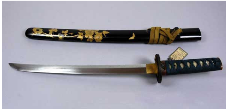
Figure 1 Wakizashi shinshin-to

Bu durumun bir sonucu olarak M.S.1645 yılında Tokugawa Shogun'luğu çıkardığı bir yasa ile kılıçların boyutlarına göre kategorize edilmesi ve taşınması ile ilgili düzenlemeyi yapmıştır. Bu yasa sonrasında "tanto", "wakizashi", "katana" gibi isimler günlük dile ve kılıç terminolojisine kılıçların uzunluğunu tanımlayan terimler olarak yerleşmiştir. Bu yasada katana 2 shaku 8 ila 9 sun (84.84cm - 87.87cm), wakizashi ise 1 shaku 8 ila 9 sun (54.54cm - 57.57cm) olarak tanımlanmıştır 6 . M.S.1648'deki ilave bir düzenleme ile chonin sınıfına mensupların ko-wakizashi 'den daha uzun kılıçlar taşınması yasaklanmış ve ko-wakizashi uzunluğu 1 shaku 5 sun (45.54cm) olarak belirtilmiştir 7 . Ancak M.S.1670'lerde yasada yapılan bir değişiklik ile chonin sınıfına yolculuk veya doğal afet durumlarında normal uzunlukta wakizashi taşıyabilme izni verilmiştir 8 .