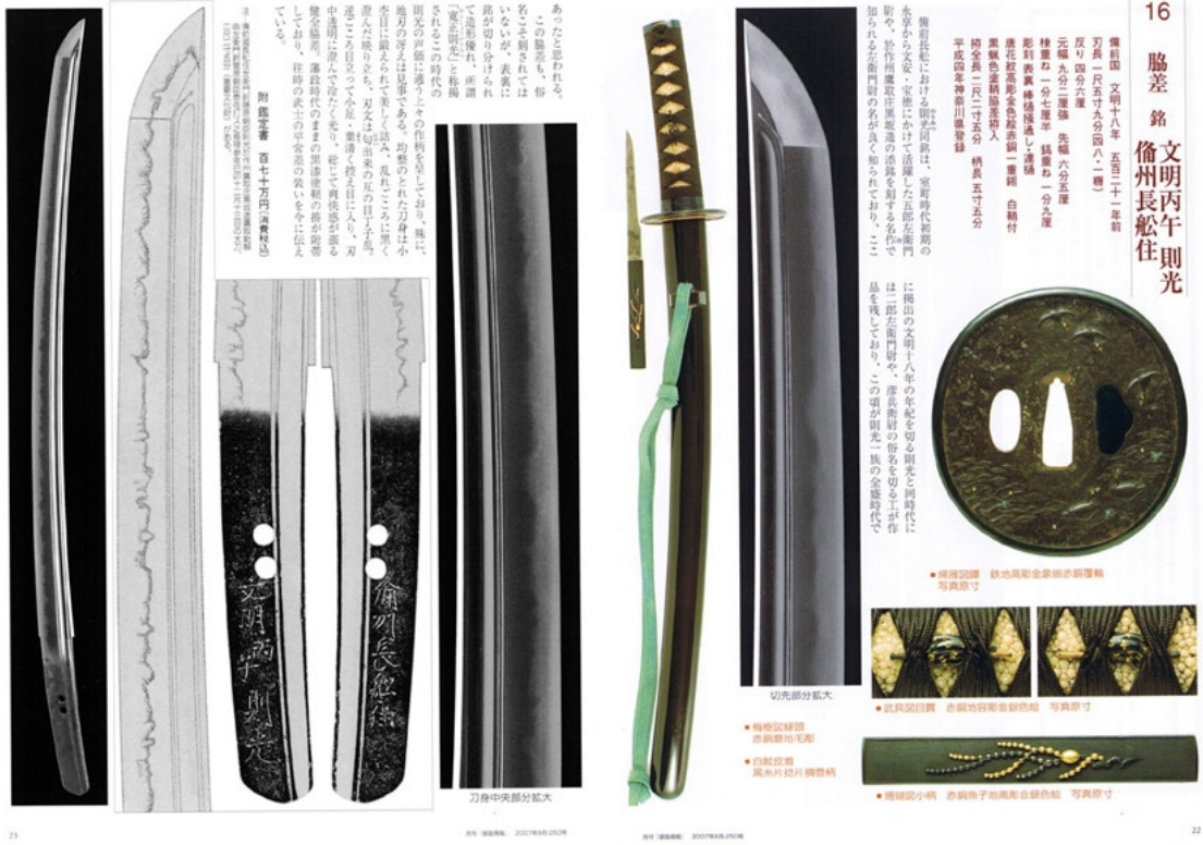
Figure 2 Geç Muromachi dönemine ait Bizen bölgesi Osafune okulunda yapılmış bir wakizashi. Nagasa uzunluğu 48.1 cm'dir.